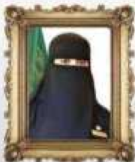
أسامة بنت عبد المطلب

سيدة نساء العالمين التي كانت من المهاجرات والتي كانت من المهاجرات