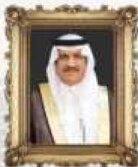
عبد الرحمن بن عبد القيل

سيدة نساء العالمين التي كانت من المهاجرات والتي كانت من المهاجرات