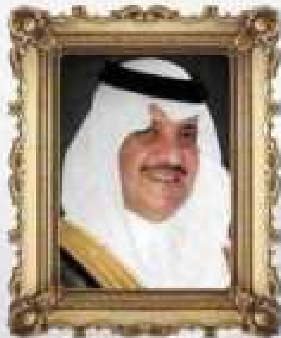
صعود بن بايق بن عبد العزيز بن آل سعود الملك فيصل بن عبدالعزيز آل سعود